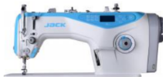
Jack JK-A4 (комплект)