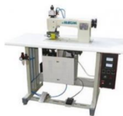
Промышленная машина JUCK U-70-A (комплект) 308.085,12 руб.