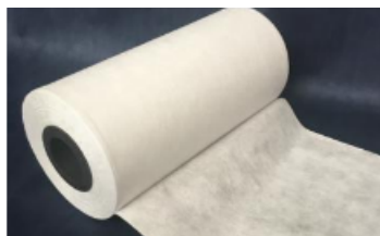
СПАНБОНД (SMS) 25ГР/М2 (СОРТ А)