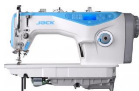
Jack JK-A5WN (комплект)