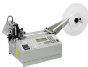
для нарезания ленты JUCK JM-120- LR (комплект) 178.799,40 руб.