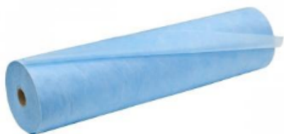
СПАНБОНД (SMS) 25ГР/М2 (СОРТ В)