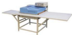
Проходной пресс JUCK SR-600